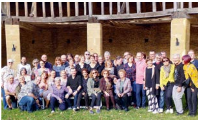
Détente et convivialité étaient au rendez-vous à notre stage d'un weekend en plein cœur du Gers

Par ailleurs, nous vous convions par avance à notre soirée Rock Salsa Bachata Kizomba ouverte à tous, qui aura lieu à la Salle Polyvalente le samedi 27 avril. En attendant, Saint-Geniès Danses vous souhaite une merveilleuse année 2024 !